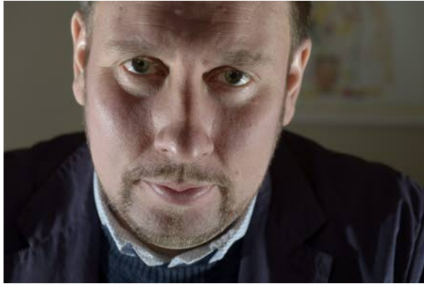
Vasemmistoliiton puheenjohtaja, kansanedustaja Paavo Arhinmäki.